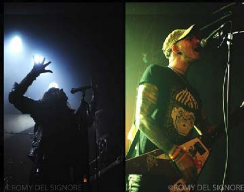
AESTHESIA - Metal Addiction Photos © 2011 Romy Del Signore

Certains critiques auraient comparé le groupe aux plus grands, lors de la sortie du second opus, et il ne m'aura pas fallu longtemps pour en faire de même... Un de ses membres me surprend au bout de quelques minutes : le chanteur !