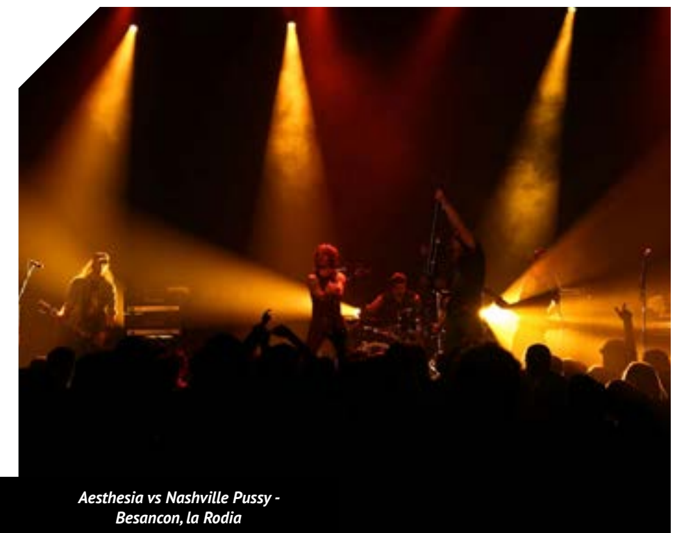
Aesthesia vs Nashville Pussy - Besancon, la Rodia

12 titres. Dont les 5 titres -réenregistrés- de la démo précédente ainsi que sept autres titres.