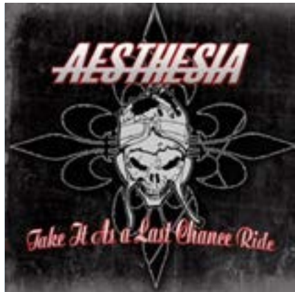
Take It As a Last Chance Ride

2005 Autoprod. Demo Distribution : Brennus Records/Perris Records