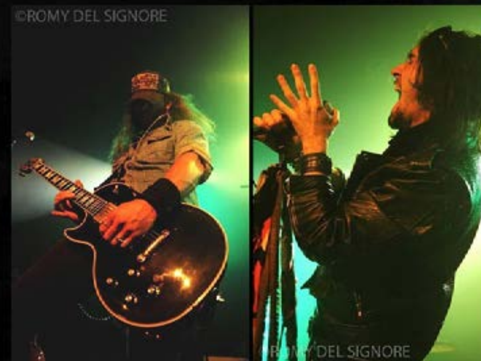
AESTHESIA - Metal Addiction Photos © 2011 Romy Del Signore

Environ une heure de show pour AESTHESIA qui se retire, ovationné par le public, pour se diriger dans la fosse afin de rejoindre ses fans.